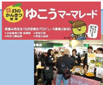
販売・市場調査 (東京交通会館)