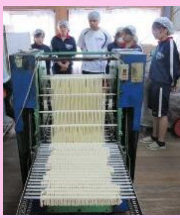
○地元企業とのそうめん試作 (農産物 × 地元特産品)