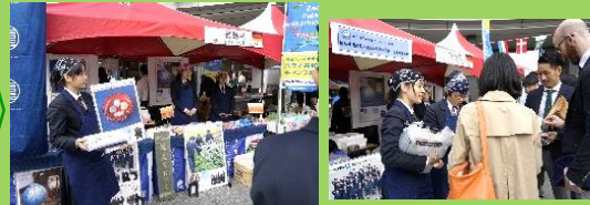
(東京スカイツリー ソラマチひろば)