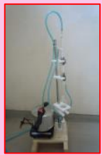
オリジナル「精油製造装置」製作

未利用農産物の商品化 → エシカル商品 ※摘果による青玉ハッサク 杉、檜の枝などから アロマオイルの精製