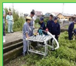
(協力: 県農総技センター)