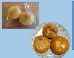
地域のお店との連携商品