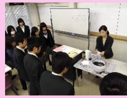
アロマオイル × そば殻