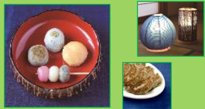
藍の和菓子・餃子, 藍染(阿波和紙)行灯