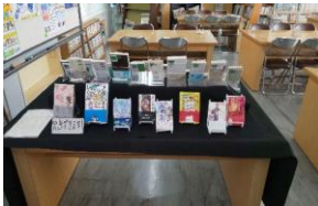
↑ 昨年度のフェアの様子です↑

○本だけでなく「タウンクシマ」「日本映画navi」「ジュニアエラ」などの雑誌や、新聞も閲覧することができます。